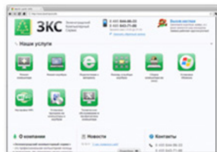
Сайт компании “Зеленоградский компьютерный сервис”