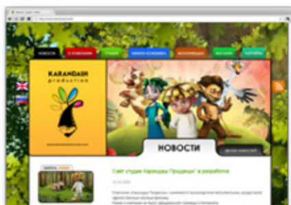
Сайт студии “Карандаш Продакшн”