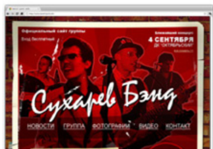
Сайт группы “Сухарев Бэнд”

Все работы смотрите на нашем сайте: http://popel.com.ua/portfolio/