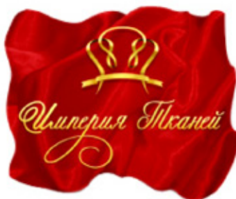
Фирменный стиль магазина “Империя тканей”