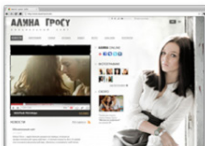
Сайт певицы Алины Гросу